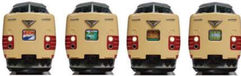
【はんわライナー】 【やまとシライナー】 【まほろば】 【しなの】

KATOの381系100番台「くろしお」(10-1868)にお使いいただける変換式トレインマークとグレードアップシールのセットです。車両製品に標準装備されていない右図内容のトレインマークと行先表示シールを各1編成分収録しています。381系100番台がかつて各地の路線を担当していた特色ある列車を再現してお楽しみください。