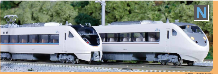
JR西日本商品化許諾済