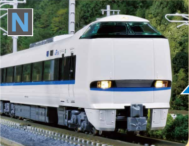
JR西日本商品化許諾済