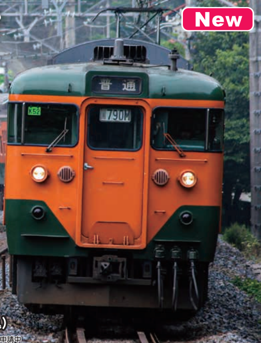
写真: 目黒輝勝 協力: railways 湘南ライン JR 東日本商品化許諾申請中

東海道線の東京口を発着する中距離電車はグリーン車を連結した最大15両の長編成で運転され、並走する京浜東北線や山手線の通勤電車とは一味違う独特の雰囲気を漂わせています。ステンレス車体の211系にJR移行後に連結された2階建てグリーン車は、のちに113系にも連結されることになりました。鋼製車体の編成に連結されたステンレス車体のグリーン車は編成のアクセントとして、多くの利用者の印象に残りました。KATOでは、東京口の中距離電車の一つのテーマとして、製品のラインナップを充実させています。4月ポスター発表のE217系東海道線をはじめ、113系・211系・E231系・E233系と東海道線を彩った名優たちが勢ぞろい! 様々な時代を駆け抜けた湘南色の電車をKATOのNゲージでお楽しみください。