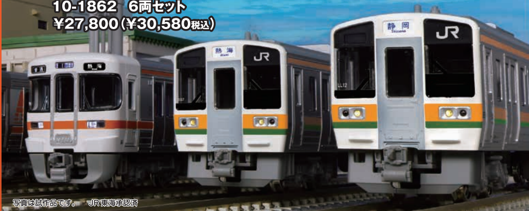
写真は試作品です。 JR東海承認済