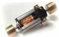
写真:菅野敬太 協力:ジオラマ103